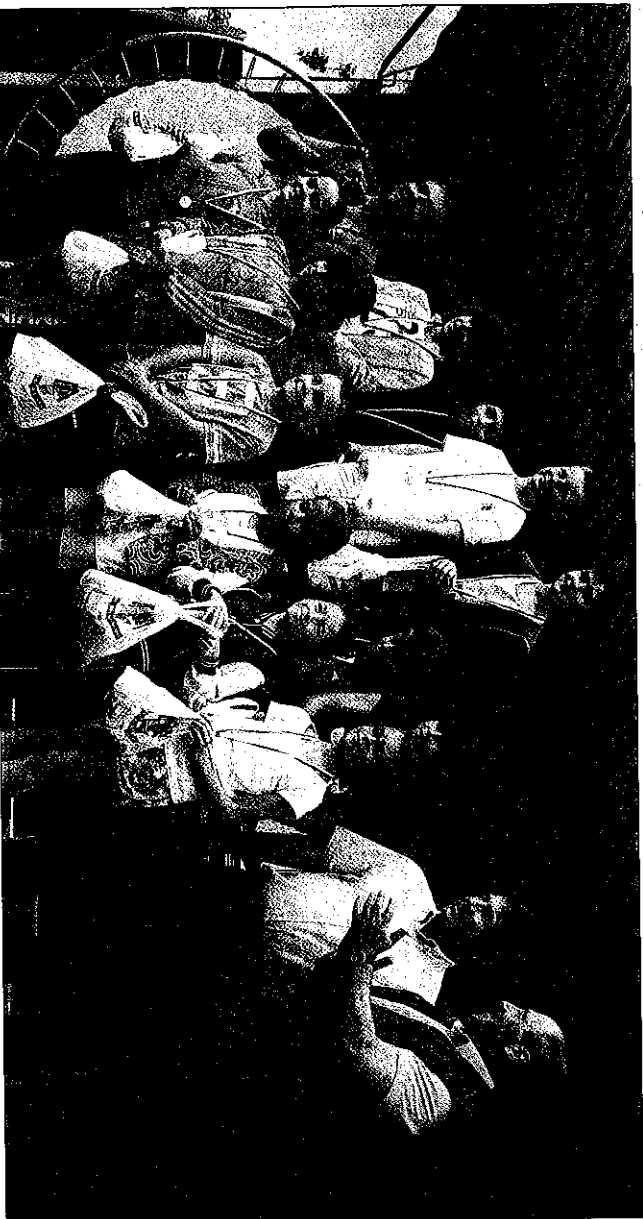
Vernajou, la course qui fait la part belle aux jeunes. Ici, le podium 2014.